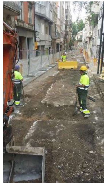
Tram inicial del Carrer de Septimània on finalitzaren les obres. A l'esquerra s'observa com es retira paviment d'asfalt UE 01. Al centre s'aprecia els nous embornals de formigó del clavegueram UE 07. A la dreta es veu la sola de formigó UE 02 a la vista després d'haver retirat el paviment d'asfalt que la cobria.