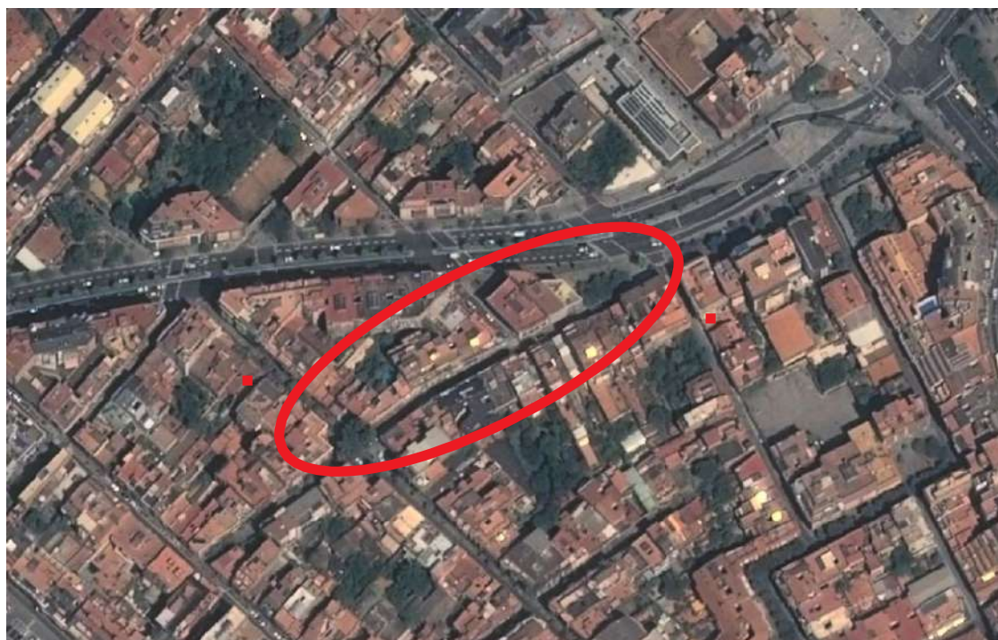
Vista aèria de l'emplaçament de la intervenció arqueològica (2013).