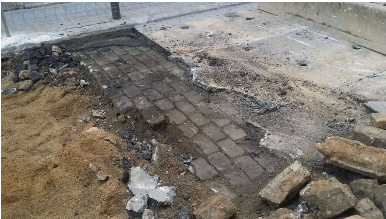
Paviment de llambordes UE 03 al Carrer de Septimània.

Però a l'alçada del número 32 del Carrer de Septimània, el paviment d'asfalt UE 01 en comptes de d'assentar-se sobre una preparació de sauló, ho feia directament sobre un paviment de llambordes UE 03. Aquest paviment tenia una preparació UE 09 de terra de tipus sauló de color negre o fosc, una mica mes compactada, i d'un gruix d'uns 5-10 cm.