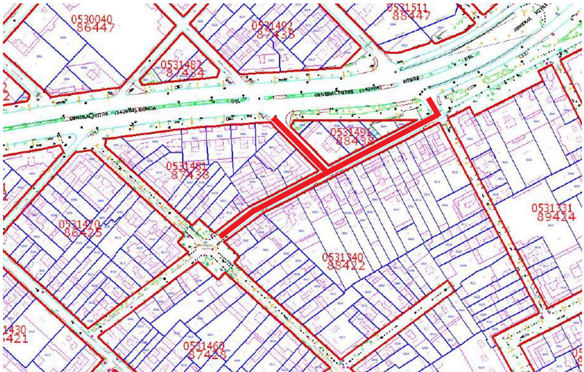
Emplaçament de la intervenció arqueològica.