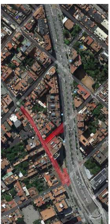
EN VERMELL, IMATGE AÈRIA DE LA ZONA D'INTERVENCIÓ