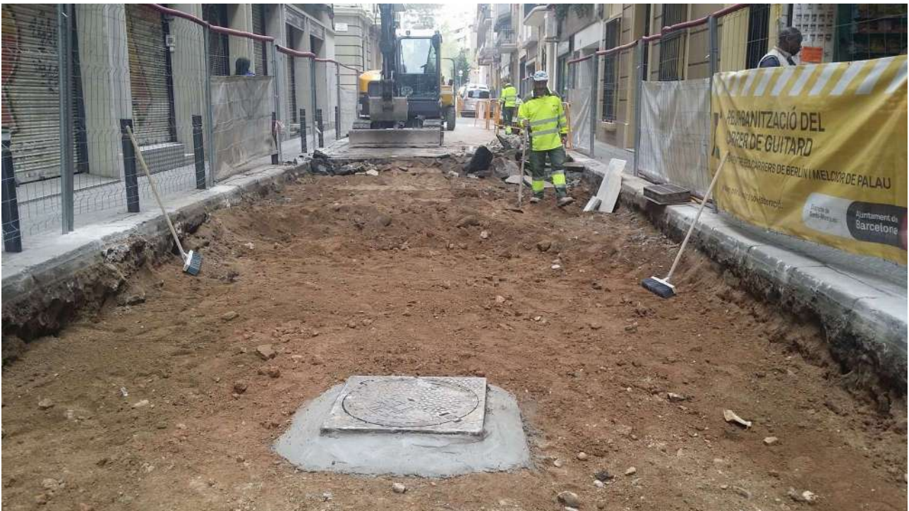
Carrer de Septimània. S'observa que els paviments d'asfalt UE 01 i de llambordes UE 03, ja estan retirats deixant al descobert l'estrat de sauló UE 04 i posteriorment l'estrat argilós UE 05. També queda al descobert el clavegueram actual UE 07,

Després del rebaix de 50 cm d'aquest tram central tampoc es va apreciar que aparegués cap estructura ni nivell arqueològic, donant un resultat negatiu al seguiment realitzat.