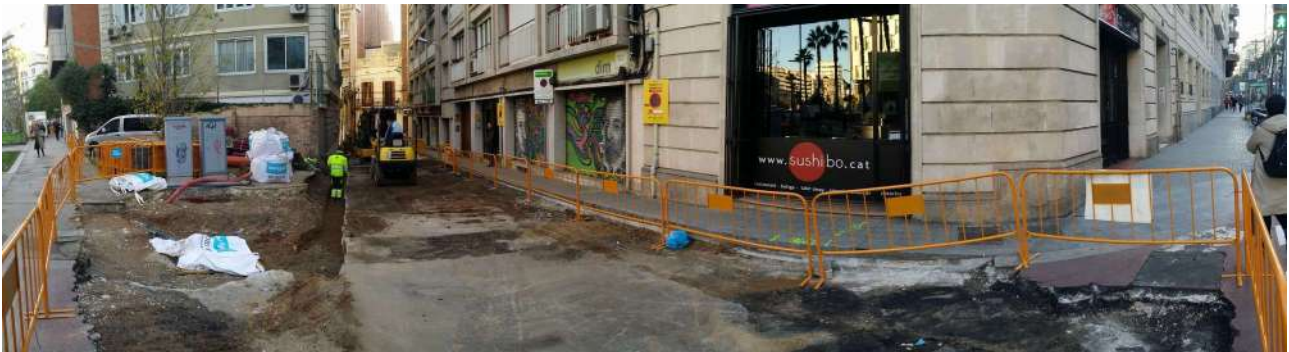
Fotografia panoràmica del Carrer Berna feta des de la Ronda del general Mitre.

El resultat del seguiment arqueològic durant la realització de les obres del « Projecte executiu de reurbanització del carrer de Septimània i del carrer Berna », al districte de Sarrià-Sant Gervasi de Barcelona, ha donat un resultat negatiu.