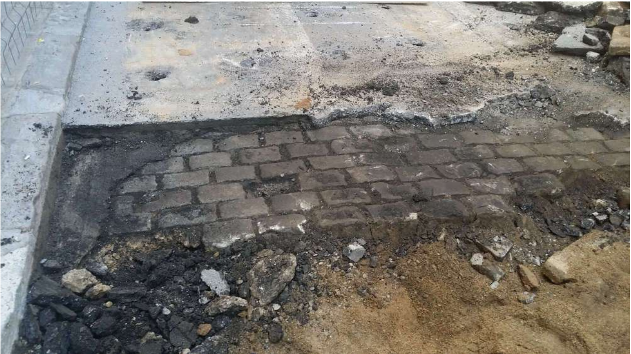
Les úniques restes trobades van ser dos petits trams de paviment de llambordes UE 03, de períodes recents, al Carrer de Septimània.

Es recomana que, degut als antecedents històrics i arqueològics, i a que no s'ha arribat al terreny geològic en cap punt, es mantinguin els seguiments arqueològics en tota intervenció que afecti aquesta zona.