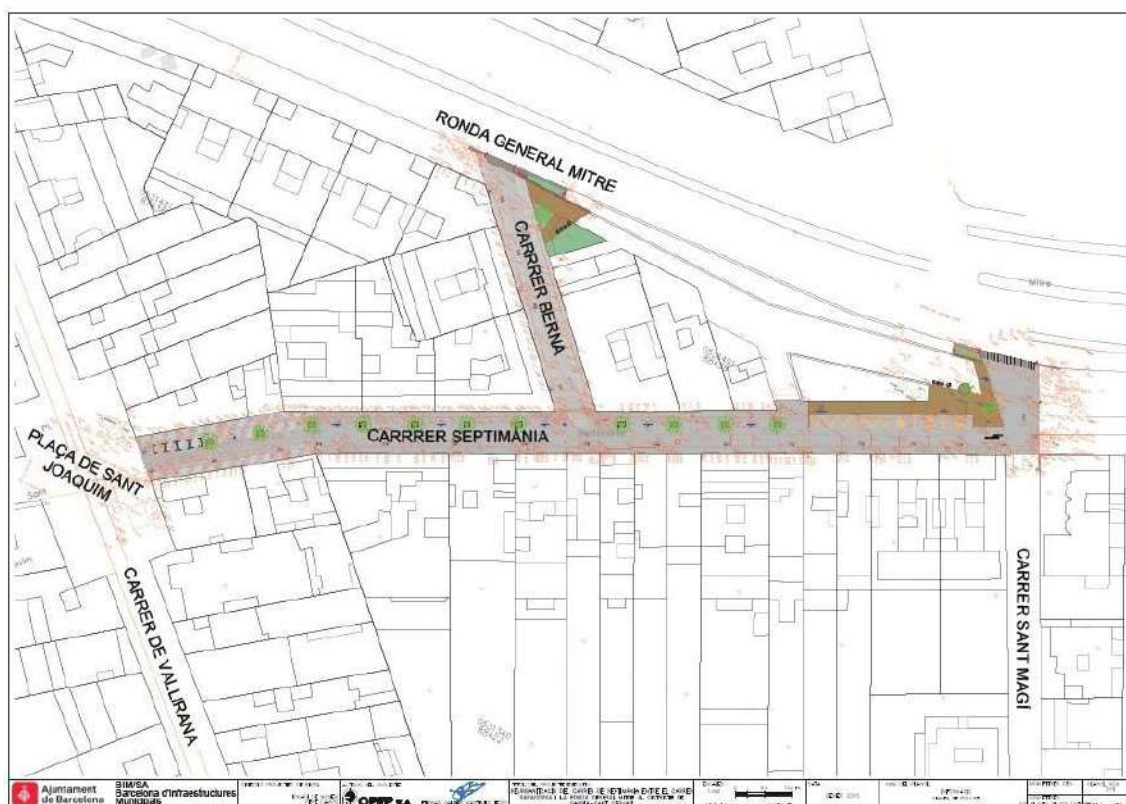
Emplaçament de la intervenció segons el Projecte d'Intervenció Arqueològica.