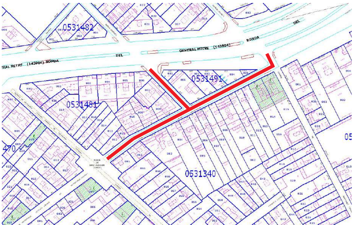
Emplaçament de la intervenció al Catàleg del Patrimoni Arquitectònic.