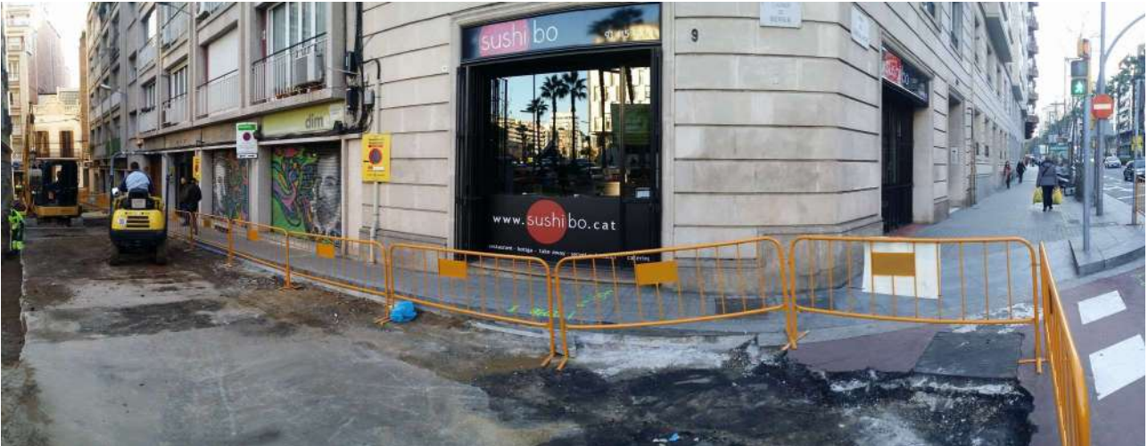
Cantonada del Carrer Berna amb Ronda General Mitre. Al fons i a l'esquerra hi ha el Carrer de Septimània. S'observa el tram central del Carrer Berna amb el paviment d'asfalt UE 01 retirat, quedant al descobert la sola de formigó UE 02.

El primer punt on va començar l'obra va ser al carrer Berna. Aquí es va retirar el paviment d'asfalt UE 01 de la part central del carrer i a sota va aparèixer una sola de formigó UE 02 com a preparació del paviment d'asfalt. Aquesta sola no es va retirar i es va fer servir per col·locar-hi a sobre el nou paviment del carrer fet de llambordes de ciment.