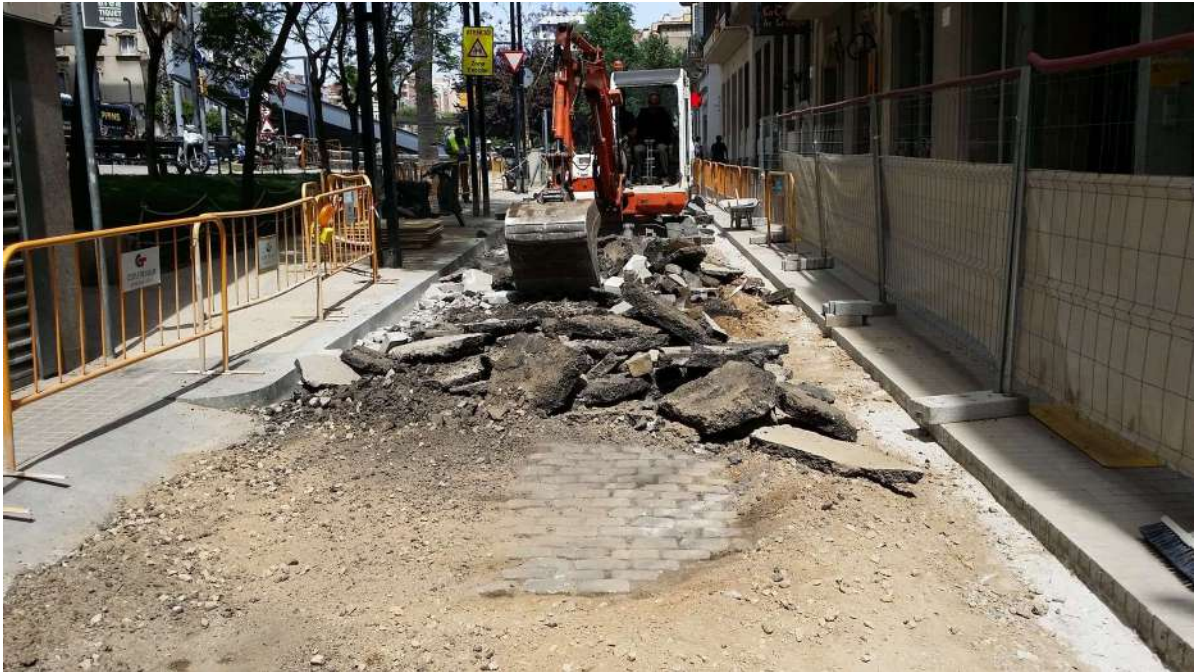
Tram final de les obres al Carrer de Septimània. S'observa les restes del paviment de llambordes UE 03 anterior al paviment d'asfalt UE 01. Es veu clarament com només queda la part central del paviment de llambordes degut a les diverses remodelacions que ha patit el carrer.

manera aquesta sola no es va retirar i es va aprofitar per col·locar el nou paviment de llambordes ja que ja era prou ferm.