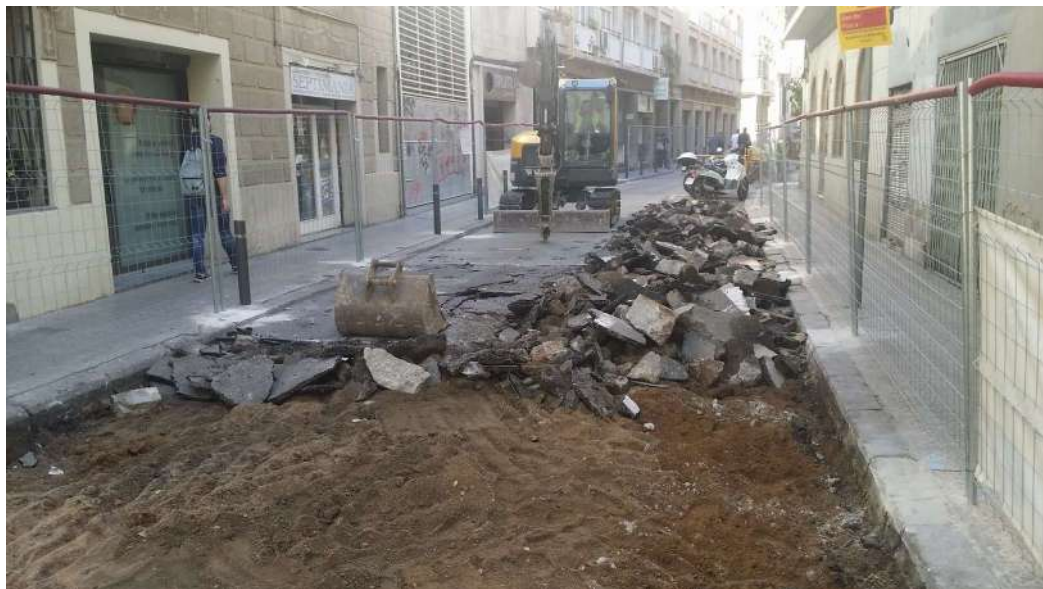
Zona d'inici de les obres al Carrer de Septimània al numero 51.

Per la reurbanització i repavimentació del carrer es necessitava fer un rebaix d'uns 50 cm des del nivell de circulació actual. Primer es va retirar el nivell d'asfalt UE 01 que tenia uns 10 cm de gruix, i després la preparació de sauló UE 04 que tenia uns 15 cm de gruix.