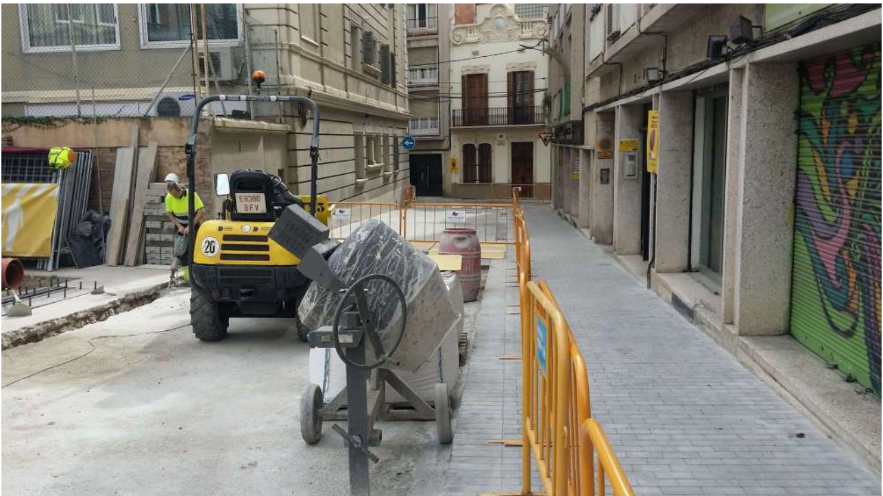
Foto del Carrer Berna amb Carrer de Septimània al fons. A l'esquerra ja hi ha el nou paviment de llambordes de ciment. Al centre encara hi ha la sola de formigó UE 02 que no es va retirar i que es va reaprofitar per col·locar el nou paviment. A l'esquerra s'observa la part final de la rasa del cablejat elèctric.

En aquest tram del carrer Berna no va aparèixer cap resta arqueològica donant un resultat negatiu del seguiment arqueològic en aquest tram de l'obra.