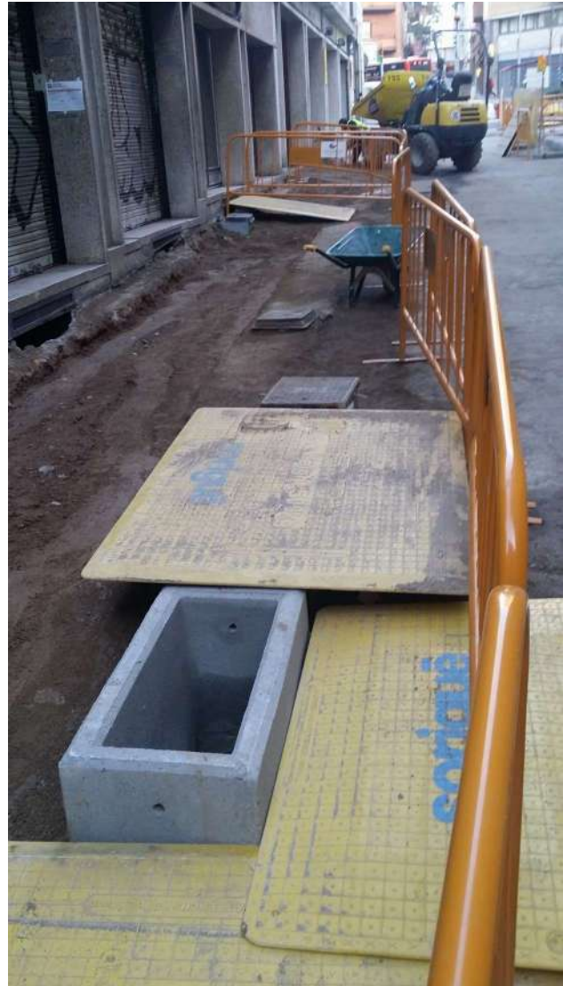
Foto dreta. Rasa al Carrer Berna amb el Carrer de Septimània al fons.

La rasa talla la sola de formigó UE 02 on reposava el paviment d'asfalt UE 01 ja retirat.