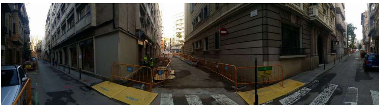
Fotografia panoràmica del Carrer Berna feta des del Carrer de Septimània.

No han aparegut estructures ni restes antròpiques relacionades amb l'Ager de la colònia de Barcino d'època romana. Tampoc han aparegut fosses amb enterraments com les aparegudes en aquesta zona. I no ha aparegut cap resta arqueològica relacionada amb cap altre període històric. Tot el que ha aparegut està relacionat amb serveis (clavegueram, telefonia, aigua,...) instal·lats al darrer quart del segle XX.