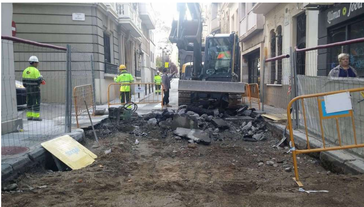
Cruïlla entre els carrers de Septimània i Berna. S'observa com sota el paviment d'asfalt UE 01 hi ha directament la capa de terra (sauló) UE 04 i a sota el nivell d'argiles UE 05.

Igual que a tot al carrer, també apareixia, al lateral dret del carrer (costat de mar), el prisma o caixa de formigó UE 08 amb el cablejat de telefònica.