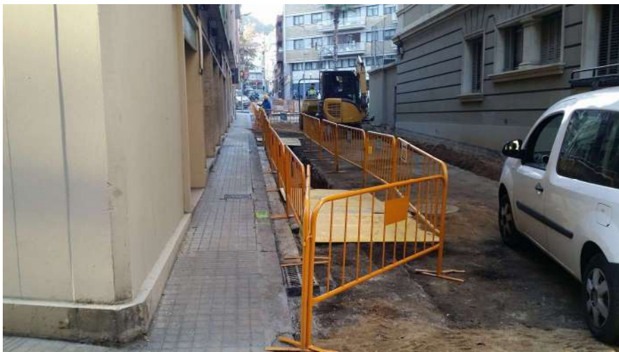
Carrer Berna vist des de la cantonada amb Carrer de Septimània. S'observa la vorera, la rasa del clavegueram, i la sola de formigó UE 02 sense el paviment d'asfalt UE 01 que el cobria.

Abans de col·locar el nou paviment es van retirar les dues voreres. Estaven construïdes amb un paviment de rajoles tipus panot i lligades amb morter de ciment, que reposava sobre un estrat UE 05, argilós de color marró i una mica compactat.