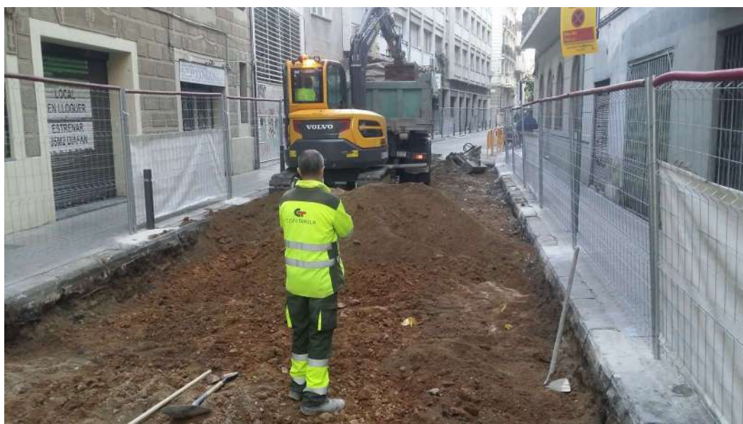
Zona d'inici de les obres al Carrer de Septimània al numero 51.

Aquesta cobria un nivell de terra argilosa de color marró UE 05, bastant compactada amb presència de graves o pedres petites i, en menor quantitat, restes i fragments de material constructiu (teules, maons i rajoles).