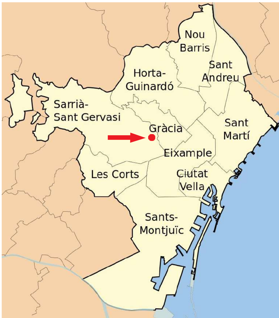
Ubicació del seguiment arqueològic dins de la ciutat de Barcelona