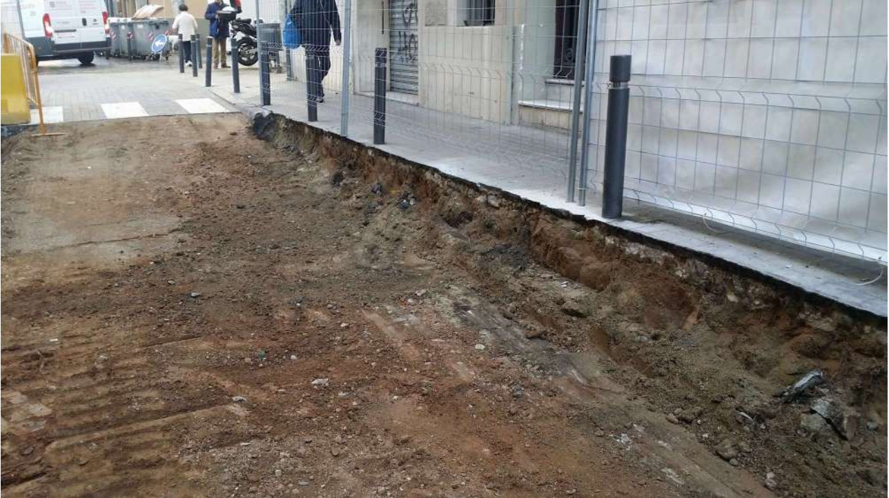
Carrer de Septimània amb Plaça de Sant Agustí al fons.

D'aquest estrat UE 05 es van rebaixar uns 20-30 cm sense que aparegués cap resta o estructura arqueològica donant un resultat negatiu del seguiment arqueològic en aquest tram de l'obra.